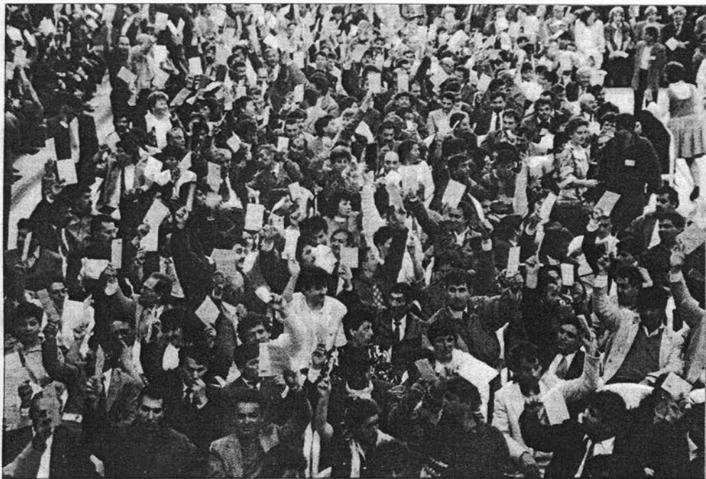
Fel a kezekkel! – szavaznak az elektorok

rán kevés szó esett. El sem fogadták, el sem vetették. Komolyabb dolgokra, a működési rend kialakítására, a posztok elosztására, az anyagi természetű kérdések megvitatására kellett az idő, idő pedig nem volt több, mert ha a közös marok később nyúlt volna be a parla-